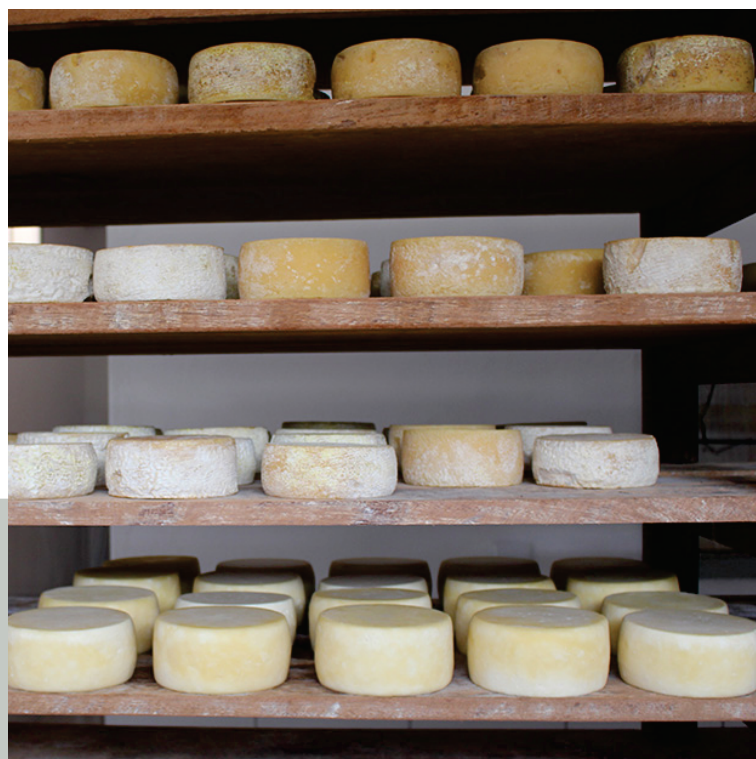
Estante de Queijos da Região do Serro em diferentes etapas de maturação