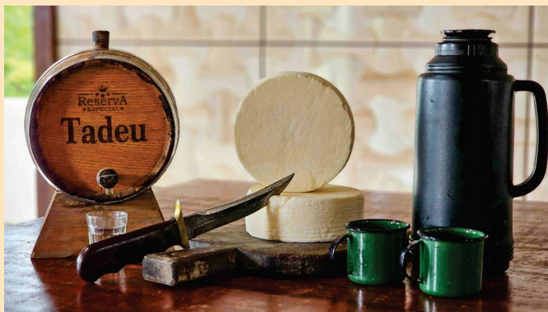
Queijo de Congonhas do Norte.

A ciência confirmou o que o paladar já dizia.