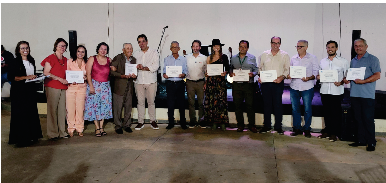
Produtores recebem do Iphan o certificado de Patrimônio Imaterial da Humanidade

Em cerimônia histórica, o presidente do IPHAN entregou aos produtores o certificado que reconhece os Modos de Fazer o Queijo Minas Artesanal como Patrimônio Cultural Imaterial da Humanidade