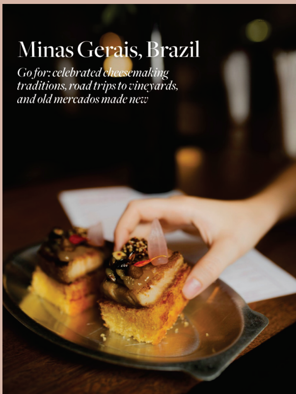
Minas Gerais em destaque na revista Condé Nast Traveler.

Go for: celebrated cheesemaking traditions, road trips to vineyards, and old mercados made new