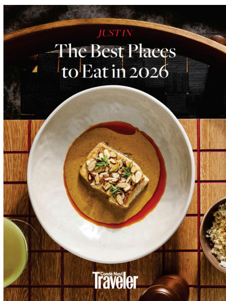
Revista Condé Nast Traveler. Divulgação

A revista Condé Nast Traveler, uma das mais prestigiadas publicações de viagem do planeta, elegeu Minas Gerais como um dos melhores destinos gastronômicos de 2026 - e o Queijo do Serro é protagonista