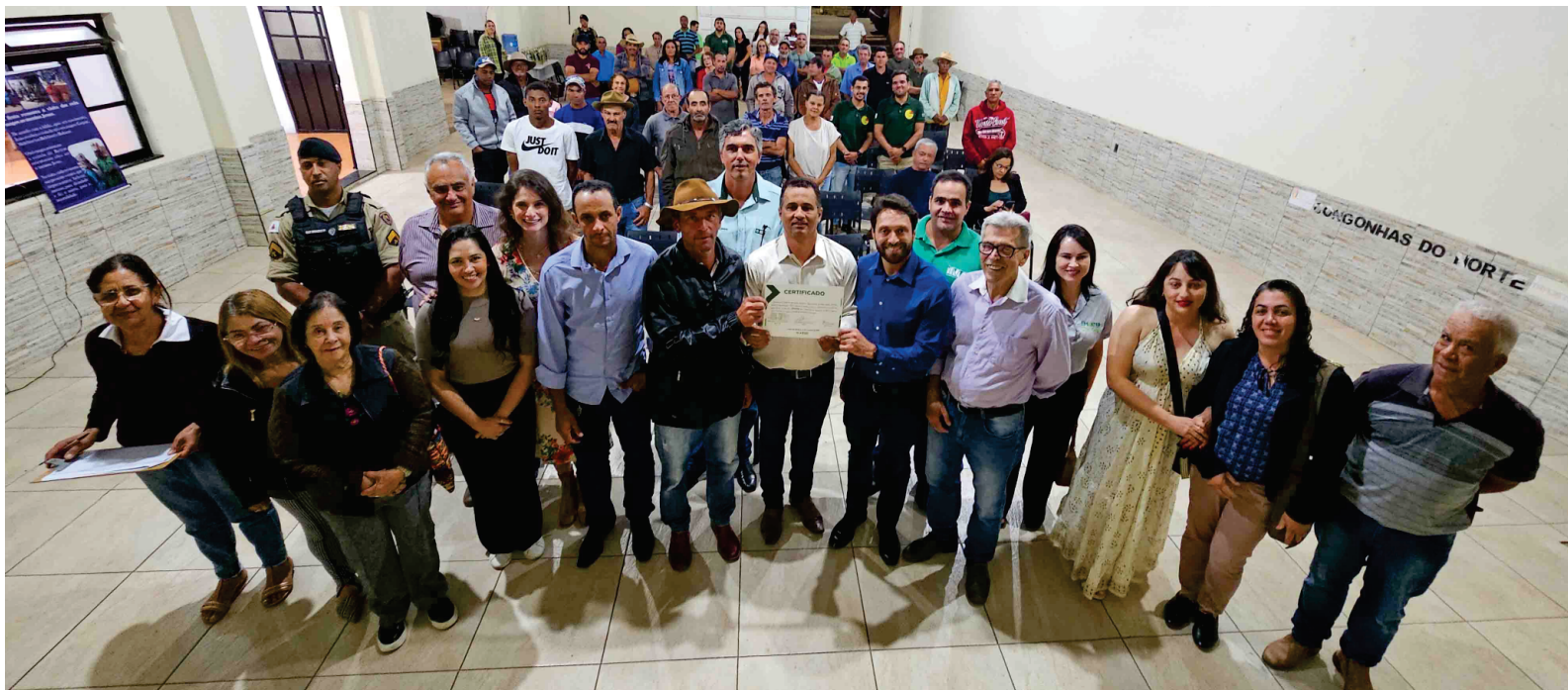
Produtores e autoridades recebem o reconhecimento de Congonhas do Norte como parte da Microrregião do Serro.